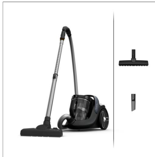
Green Force Cyclonic Effitech, Aspirateur sans sac, 500W, Eco-conçu, 68 dB(A) Aspirateur sans sac R07C36EA