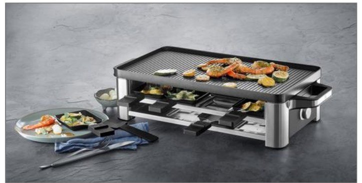
Lono Raclette-Grill 0415040011