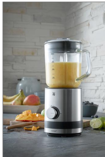
KITCHENminis Blender 0.8 L 0416490011