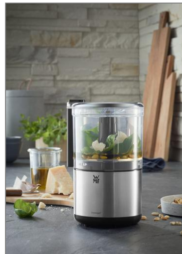
KITCHENminis Hachoir 0416580011